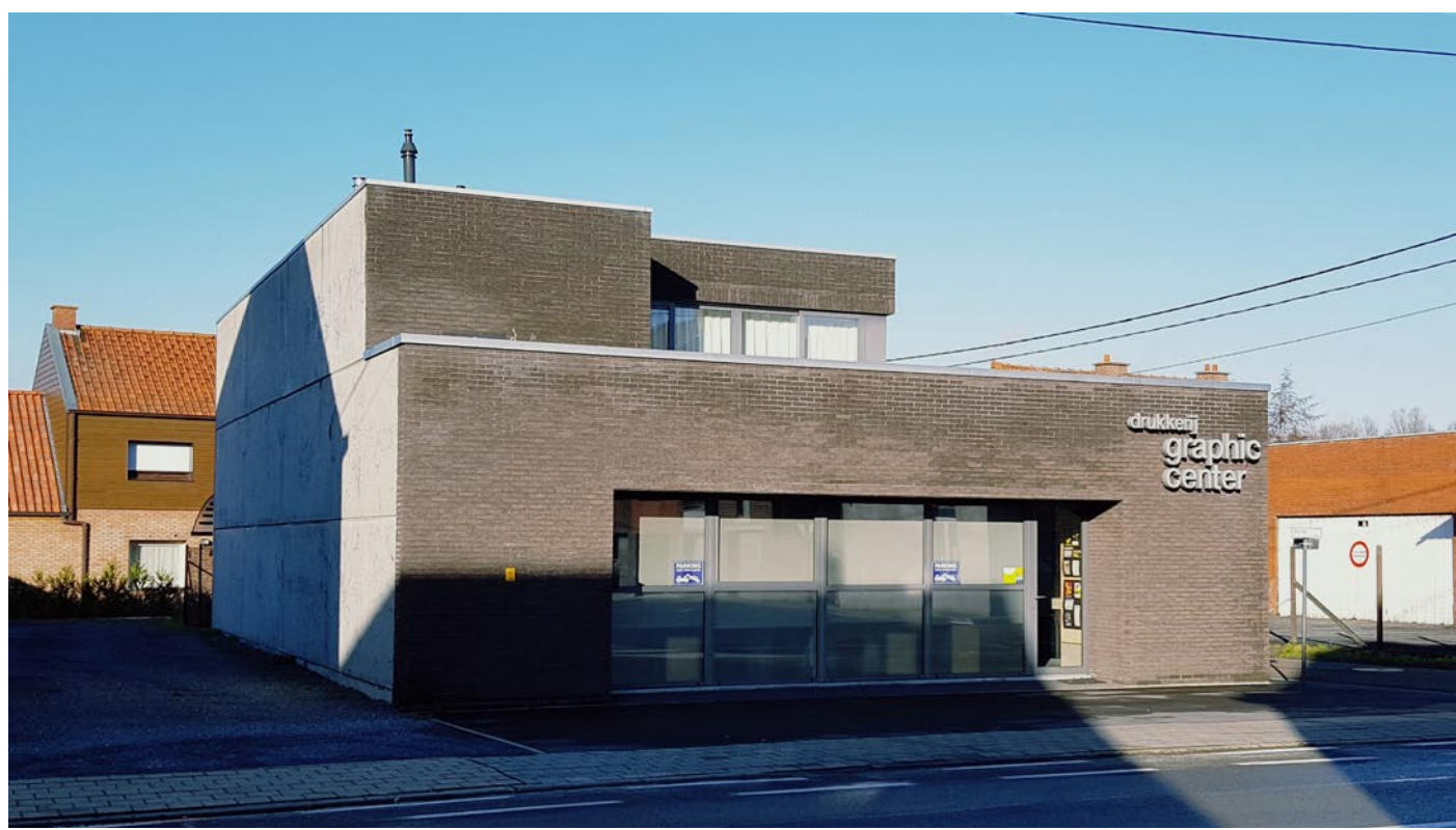
Situatie in 2018

Een tijd daarna wordt het huis afgebroken en komt er een nieuw gebouw met daarin de offsetdrukkerij Graphic Center.