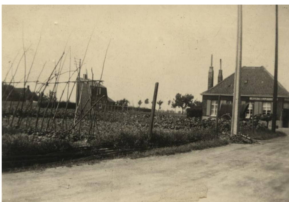
Zicht op A la Belle Vue vanuit de Hazebeekstraat