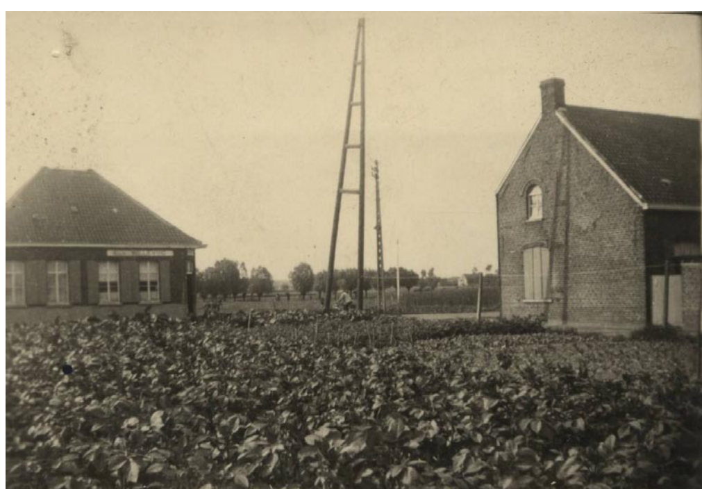
Zicht op A la Belle Vue vanuit de Hazebeekstraat (rechts in beeld) Het huis links is café De Eendracht