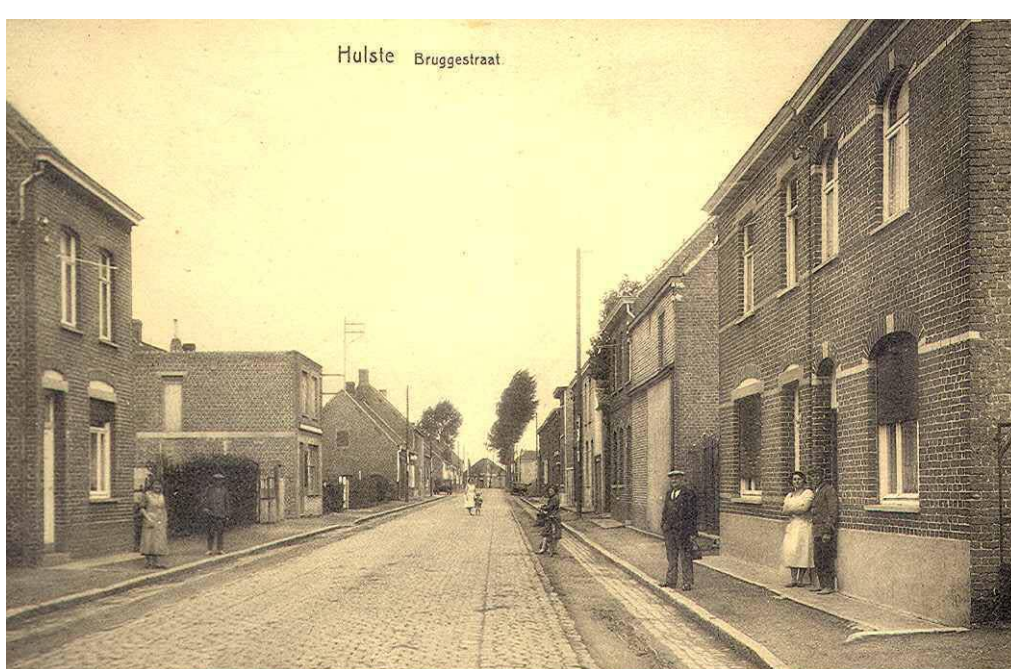
Zicht op de Brugsestraat richting Brugsesteenweg met de A la Belle Vue gans op het einde.